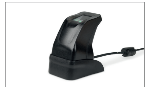
Lector de huellas dactilares USB TimeMoto FP-150 Nº de artículo: 125-0606