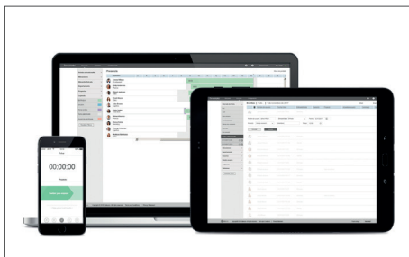
TimeMoto Cloud / TimeMoto Cloud Plus Nº de artículo: 139-0612 / 139-0613